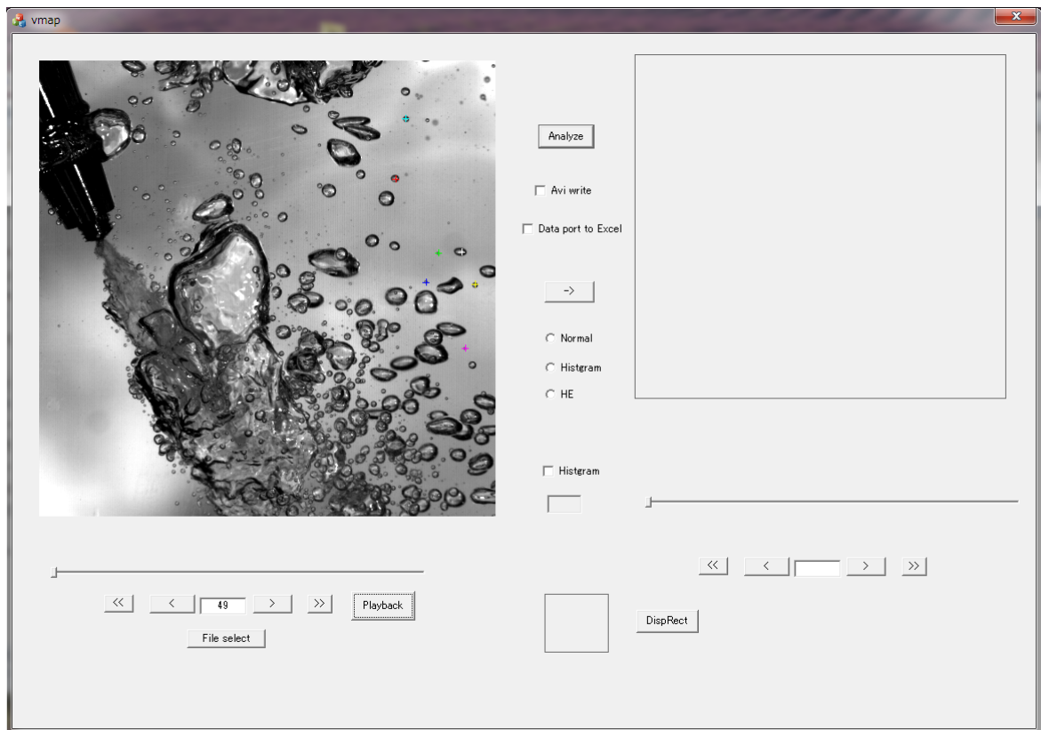
Fig. 1 Operational Panel of VMAP

GUI スタイルでの OpenMP 等での相関計算並列化のために、開発システムを切り替えたために、プログラムを全面的に書き直した。その課程で、無駄な部分を省略したためにパネルがかなり変更された。